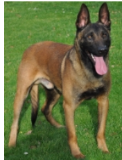
BRN 22967 | Ivo III (Dhr. H.R. Iedema, Brunssum)

PH I 427 CL (13-05-2017, Zeist) PH II 436 CL (2018, Leusden) Geb.datum: 08-11-2013 Winnaar Paaswedstrijd Afd. Utrecht 2017 Deelnemer Jan Warmerdam Bokaal 2017