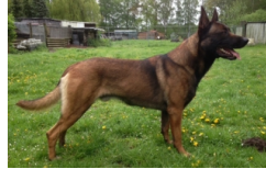
BRN 25593 | Tosca (Dhr. G. Menke, ?)

PH I 440 CL (Ommen, 06-07-2013) Geb.datum: 20-02-2010