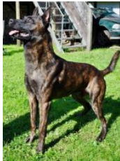
BRN 25594 | Devil (Dhr. R. Spicer, Ventura, CA, USA)

PH I 415 CL (Glanerbrug, 02-07-2017, Gel. H.G. Pegge, Hengelo Ov) Geb.datum: 23-04-2014