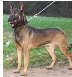
BRN 20441 | Noa (Dhr. J.E. te Lindert, Keijenborg)

PH I 413 CL (Dhr. L. Arts, Nederasselt) Geb.datum: 07-08-2006